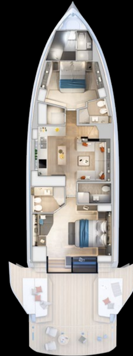
Lower deck Beach Version