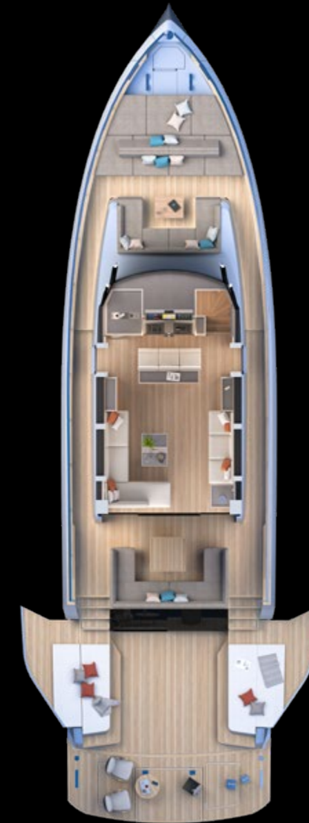
Main deck Beach Version