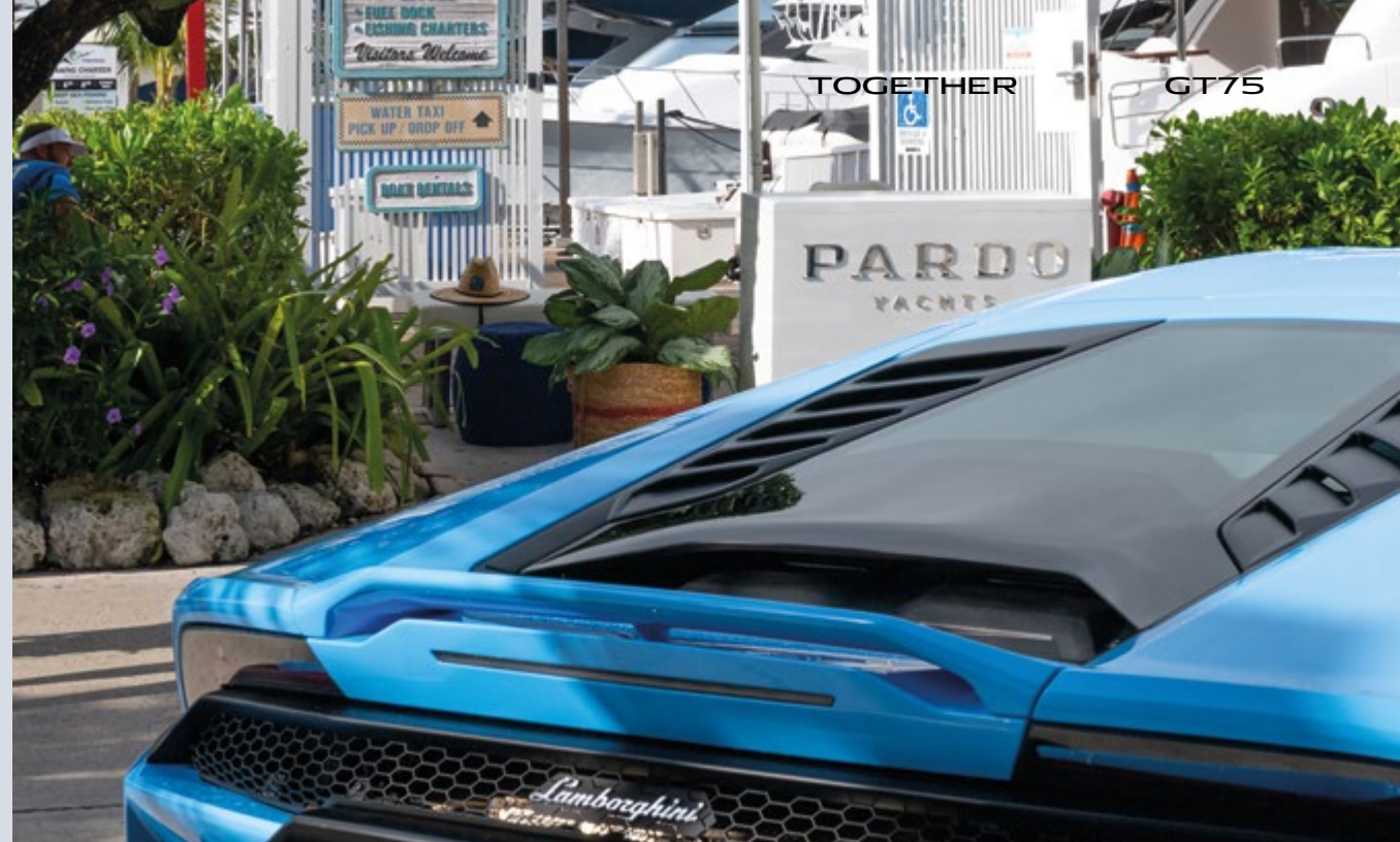
MIAMI - PARDO YACHTS & LAMBORGHINI