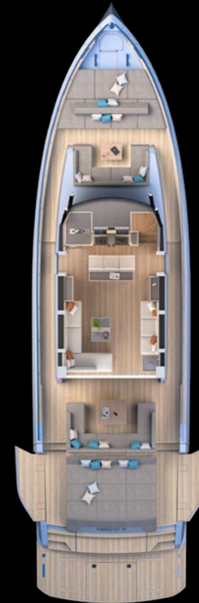
Main deck Tender Garage Version