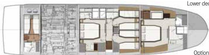
Optional 4 cabins layout